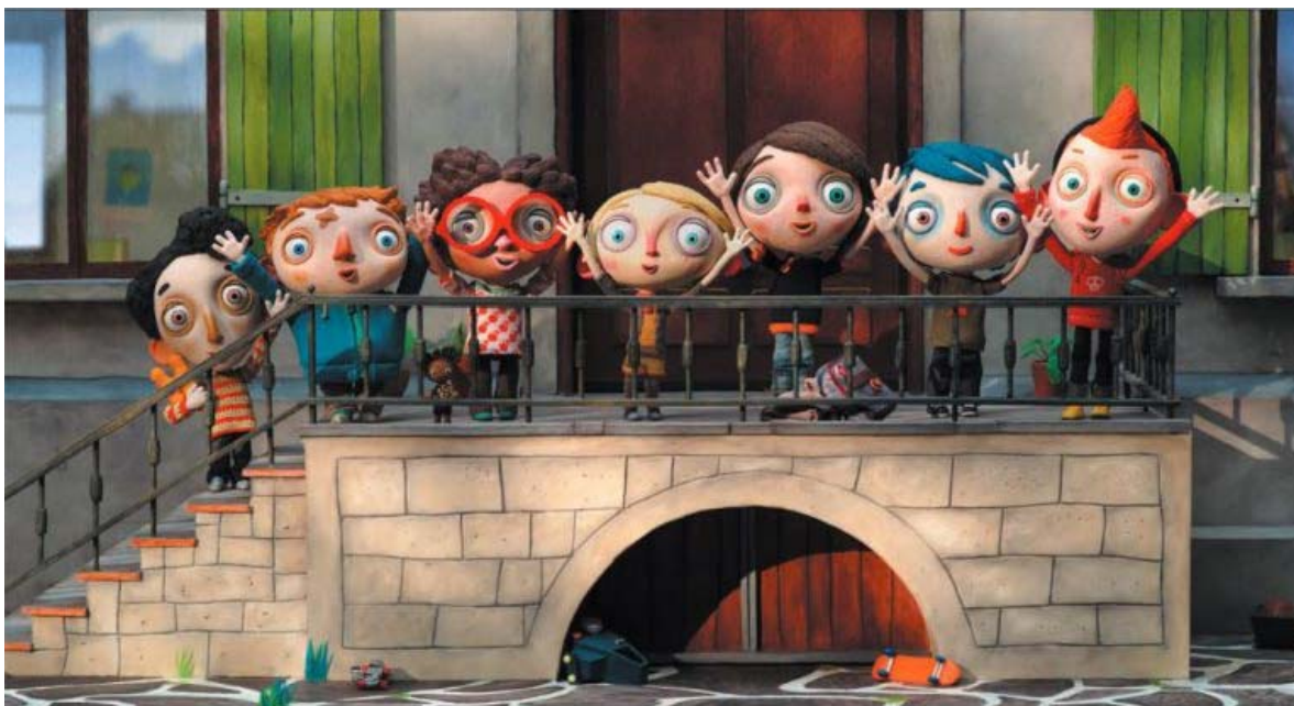
Ma vie de Courgette, le film événement qui a réalisé une audience inattendue !